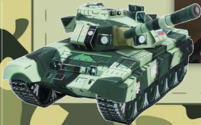
Задание «Военный кроссворд»