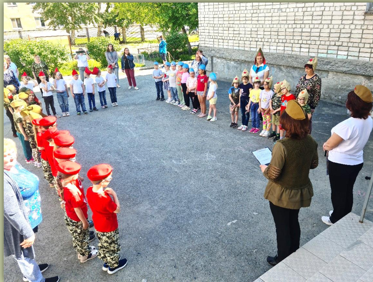
Торжественное построение. Постановка военной задачи.